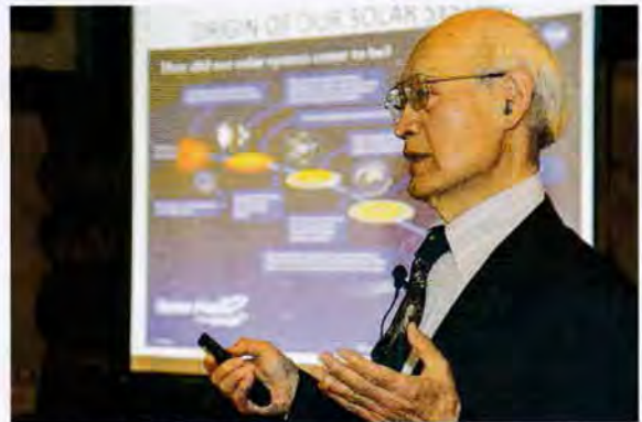
藤森氏による講演の様子