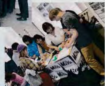
JAPAN CUPで アメリカの学生たちに 折り紙指導