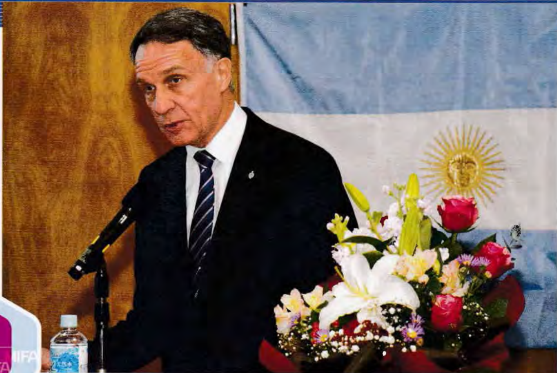
アラン・ベロー駐日特命全権大使