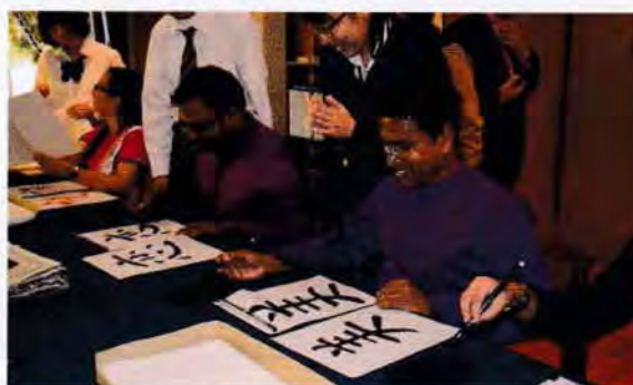
習字はいつも人気の日本文化体験です