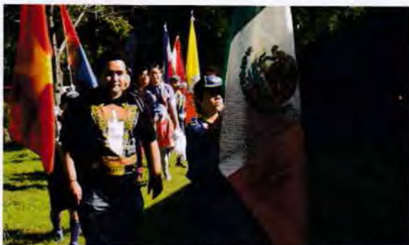
秋晴れの日に各国の国旗が鮮やかに映えました

人。一日でこんなに多くの外国人と触れ合えるのがこのイベントの魅力です。JICAの研修員も民族衣装で参加し日本文化の体験や、各国の踊りや歌を披露し大いに盛り上がりました。