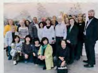
市役所での 歓迎レセプション後に ホストファミリーと

グリーンリー市内にあるノーザンコロラド大学の日本語授業の参観や、日本語を学ぶアメリカの学生たちが、日本語及び日本についての知識を競い合うJAPAN CUP（コロラド日米協会JASC主催）に参加し、守谷市と日本文化の紹介に努めてきました。