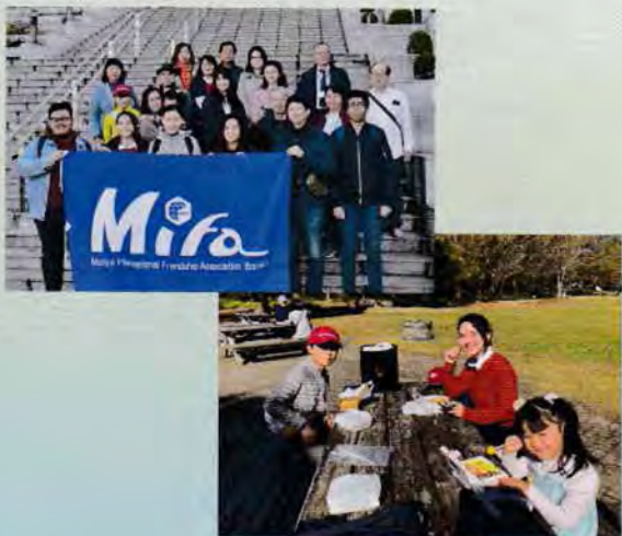
ホストファミリーと一緒に

2019年11月16日、筑波大学留学生6人を守谷市に招き、One-Day Home Visitを実施しました。家庭料理作り体験、ビール工場・筑波山・茨城県自然博物館訪問など、ホストファミリーと一緒に楽しい一日を過ごしました。このプログラムは日帰りでホストファミリーと交流するものです。ホームステイとは異なりホスト側も受け入れやすく、より多くの留学生を受け入れるのが特徴です。