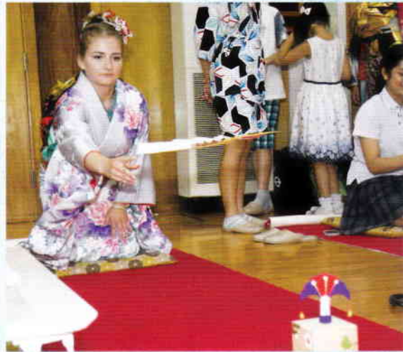
とうせんぎょう 扇子を的に当て対戦をする日本の伝統的な遊び『投扇興』。