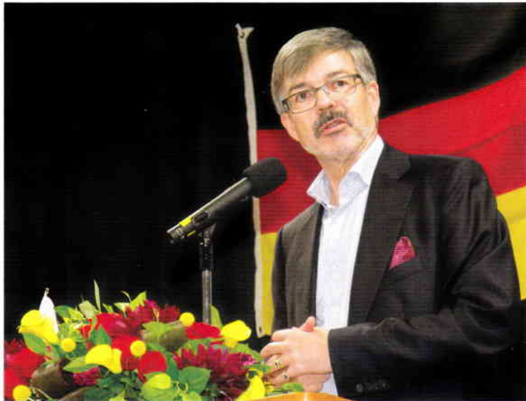
駐日ドイツ連邦共和国大使講演会。