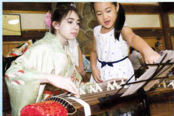
こと 着物の着付けや箏の体験をとおして交流。