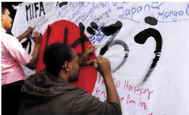
2011年のMIFAフェスタは3.11の応援一色に。

守谷市内文化団体の協力を得て、JICA 筑波の研修員と近隣在住外国人、筑波大学留学生、守谷市民が互いの文化を学び交流する場として開催しています。