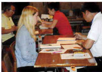
外国人のためのボランティア日本語講座。