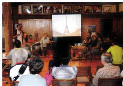
英語でおしゃべり～MIFA Chat Salon～。