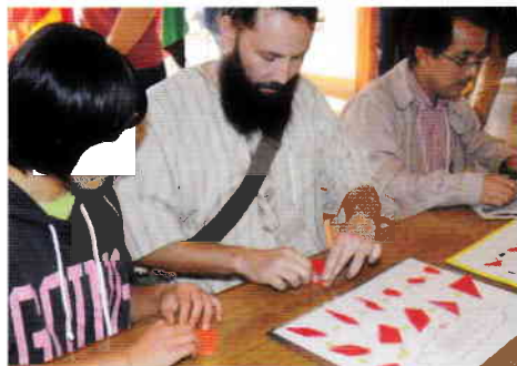
日本ならではの遊び「折り紙」体験。