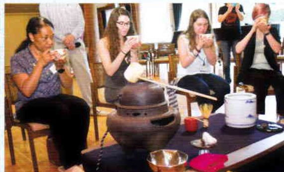
ノーザンコロラド大学の学生10人と引率者2人が来日し4泊5日守谷市に滞在しました。

昨年6月にアメリカ・コロラド州グリーリー市民が、今年5月には同市にあるノーザンコロラド大学生が来日しました。