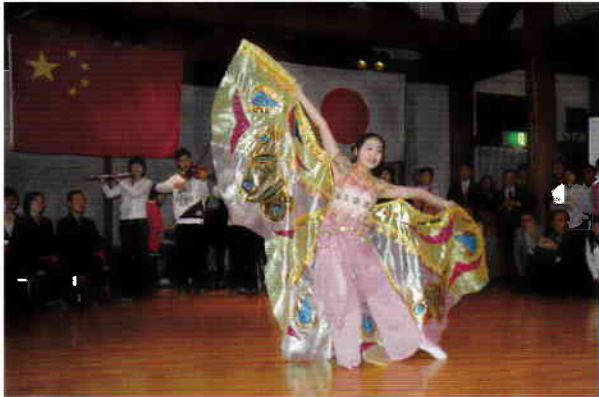
2008年 中華人民共和国の高校生との交流。

2007年(平成19年)1月に開催された第2回東アジア首脳会議(EAS)において、安倍晋三総理大臣(当時)より表明された「21世紀東アジア青少年大交流計画」。